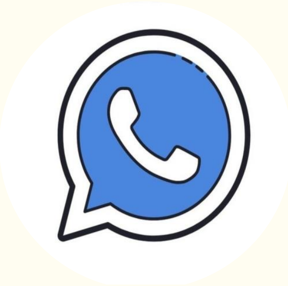
Контактный телефон 8(953)729-22-22