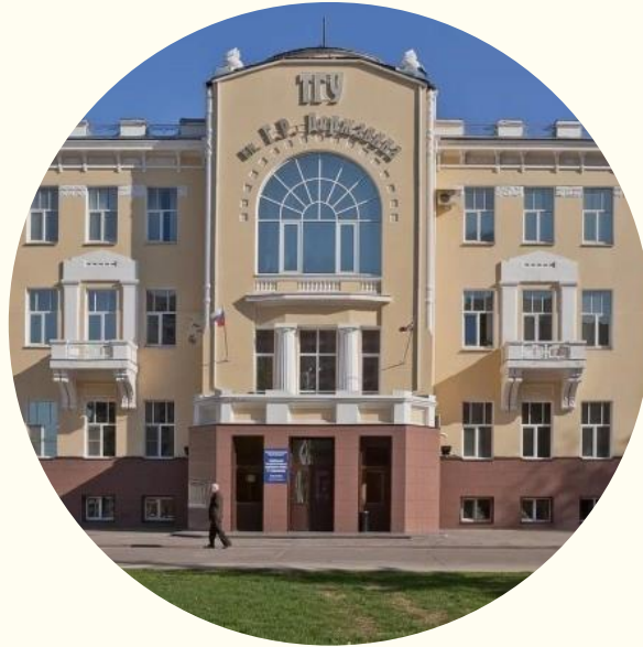
Адрес г. Тамбов, ул. Интернациональная, 33