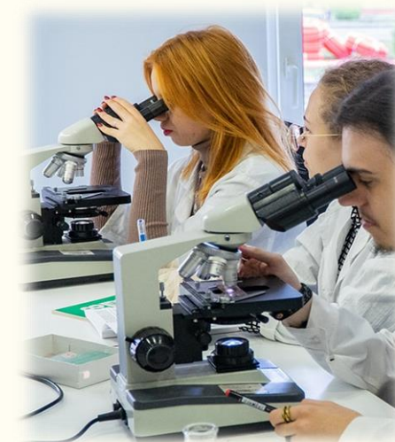
ЦЕНТР КОЛЛЕКТИВНОГО ПОЛЬЗОВАНИЯ НАУЧНЫМ ОБОРУДОВАНИЕМ ТГУ ИМЕНИ Г.Р. ДЕРЖАВИНА