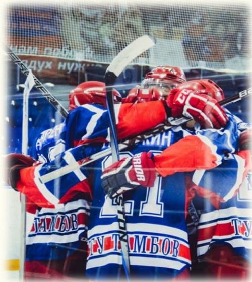
ХОККЕЙНЫЙ КЛУБ ХК "ДЕРЖАВА"